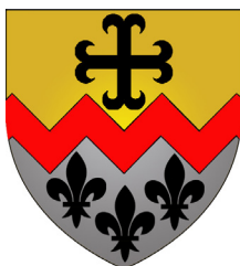
Commune de Bettendorf