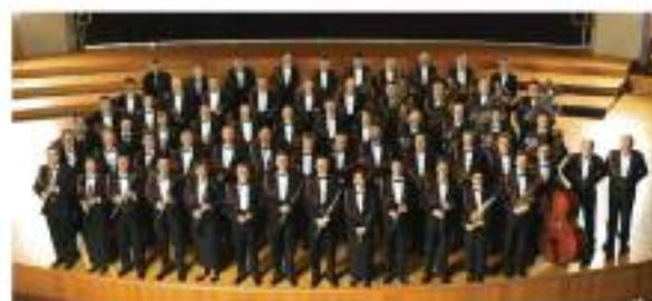
Musique Militaire Grand-Ducale