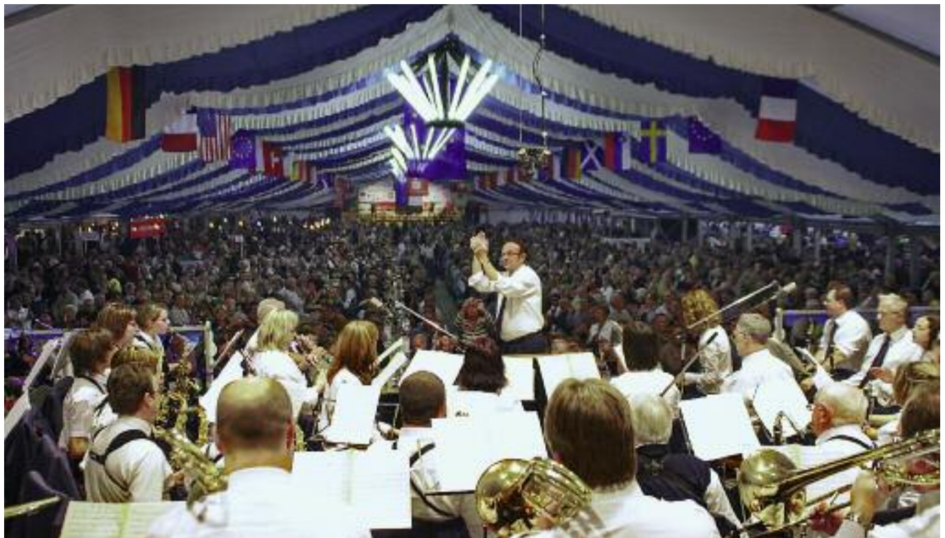
Beeindruckende Zuhörerkulisse im Festzelt

Unvergessliche Stunden und Impressionen aus Bad Schlema. (mw)