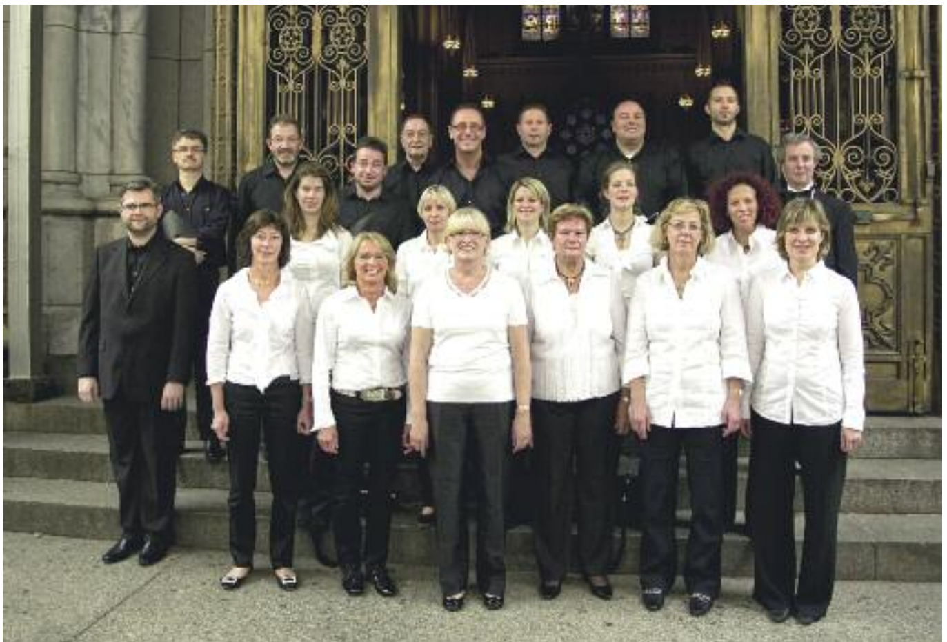
Die Chorale Ste Cécile Wormeldingen vor der St Patricks Cathedral in New York