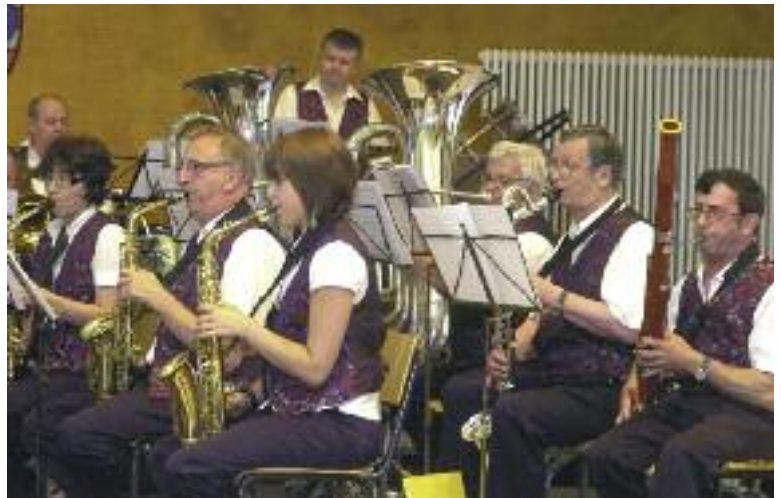
Fanfare Niederkorn