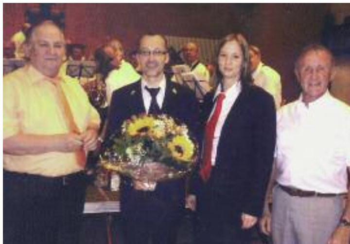
Fanfare Sandweiler

aus der Feder von Alfred Bösendorfer kaum ein Geschmack unbedient blieb.